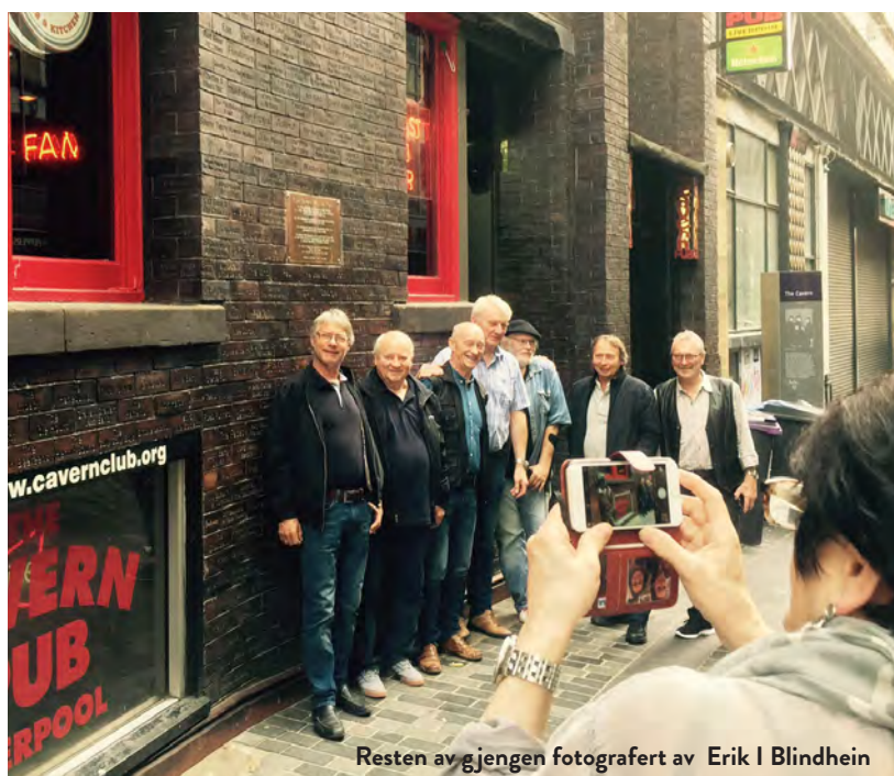
Resten av gjengen