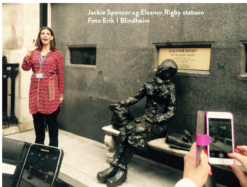
Jackie Spencer og Eleanor Rigby statuen

Det er nesten ikke grenser for hva man kan lære på en sightseeingbuss i Liverpool!!! Lime Street som er nevnt i låten Maggie May om den lett smussete MM som ble fjernet fra Lime Street – det blir mer og mer fascinerende å høre alle disse historiene om gutta fra Liverpool.